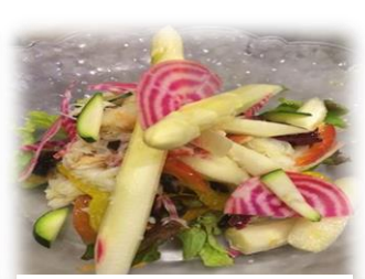
ホワイトアスパラのサラダ